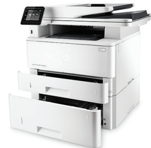
MFP (producto multifunción) HP LaserJet Pro M426fdw con bandeja de entrada de 550 hojas opcional