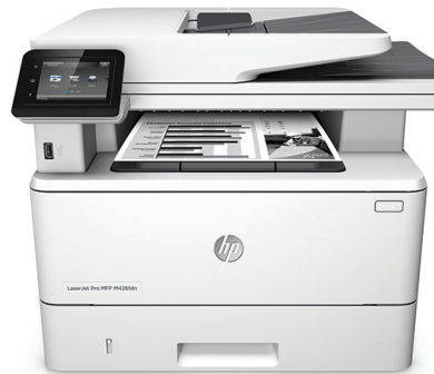
MFP (producto multifunción) HP LaserJet Pro M426fdn

Impresión, escaneo, copia y rendimiento de fax rápidos, además de seguridad sólida y amplia para su forma de trabajar. Este MFP (producto multifunción) termina las tareas clave más rápidamente y lo protege contra las amenazas. 1 Los cartuchos de tóner original HP con JetIntelligence le ofrecen más páginas. 2